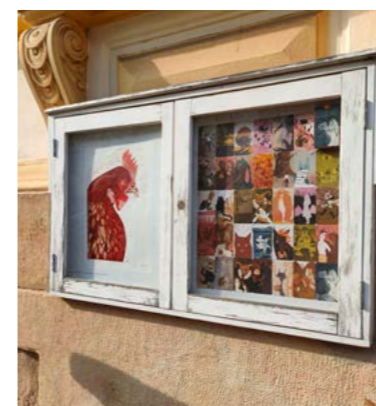
Výstava v jedné z vitrín v centru města