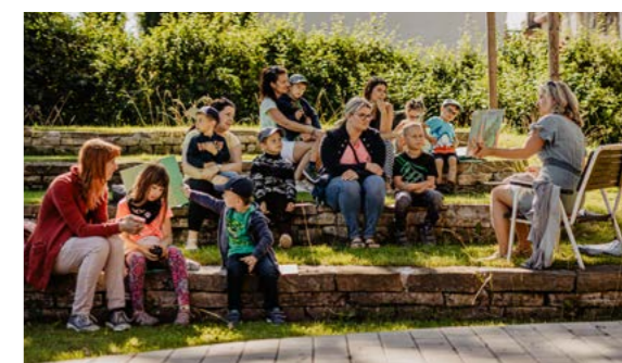
Z programu na zahradě knihovny