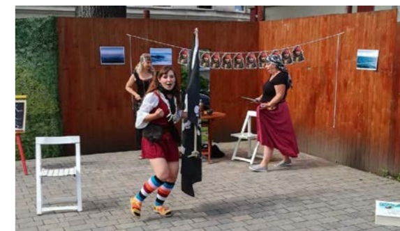
Knihovnice hrají divadlo