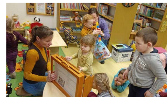
Z pobočky na Novém Městě