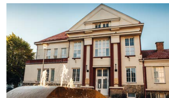
Budova knihovny v Denisově ulici

Vyvrcholením léta je v knihovně Letní jarmark konaný pravidelně poslední prázdninovou sobotu. Na zahradě se sejdou prodejci rukodělných výrobků z širokého okolí, doprovodný program nabídne nejrůznější dílničky a workshopy a v amfiteátru se budou střídát umělci všeho druhu - od divadelníků přes muzikanty až po tanečnický a kejkliře.