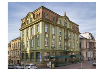
Hotel Praha (VP310)