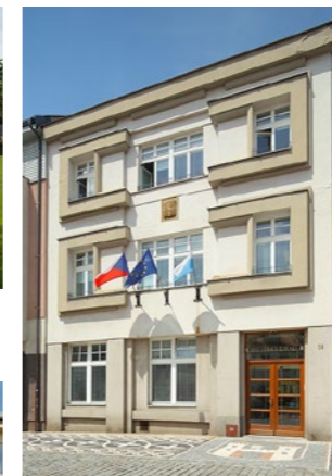
Okresní záložna hospodářská (městský úřad) (VP18)