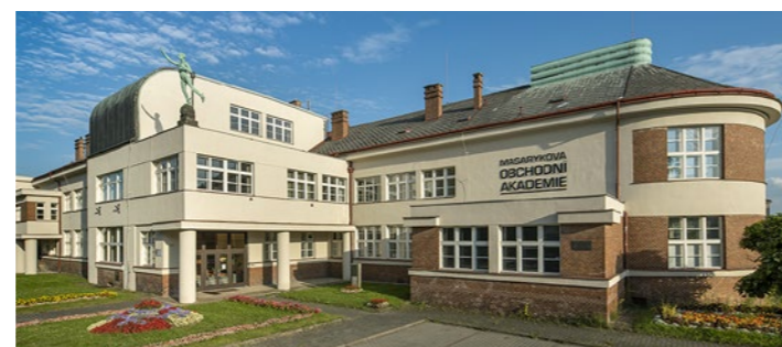
Masarykova veřejná obchodní škola (dnes Masarykova obchodní akademie) (VP220)

Z významnějších domů, které byly v meziválečném období v Jičíně postaveny, neprojektoval Musil jen Husův sbor (Denisova 613 (VP613)), vilu Otýlie Mendíkové (Krátká 252) od Emila Králíčka z roku 1934, vilu architekta Studenéno (Štrauchova 578) a dále bytový dům ve Fügnerově ulici 653 (1938–1939, Klement Ossendorf), dům rodiny Ulrichovy (Husova 65, 1928, Vít Obrtel) a z veřejných budov divadlo Český ráj – pozdější kino (17. listopadu 47, 1923, firma Gröger, Hemerka a spol.), úspěšně rekonstruované v letech 2017–2018 (PP47).