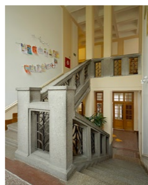
Studentský dům (Knihovna Václava Čtvrťka) (VP400)