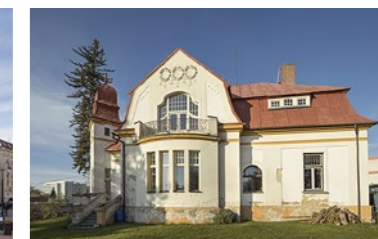
Marečkova vila (sbor Českobratrské církve evangelické s modlitebnou) (VP289)

Texty: Gabriela Adámková (Petrová), Tamara Baudišová, Eva Chodějovská Jazyková korektura: Ondřej Dufek Grafický design a sazba: Tuan Vuong Trong Předtisková příprava: Zdeněk Franc Tisk: RK TISK Jičín Vydal: Jičínský spolek pro architekturu a urbanismus v roce 2020, aktualizovaný dotisk 2021